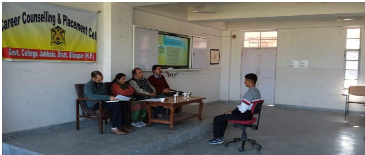
Students are being interviewed in the mock-interviews.