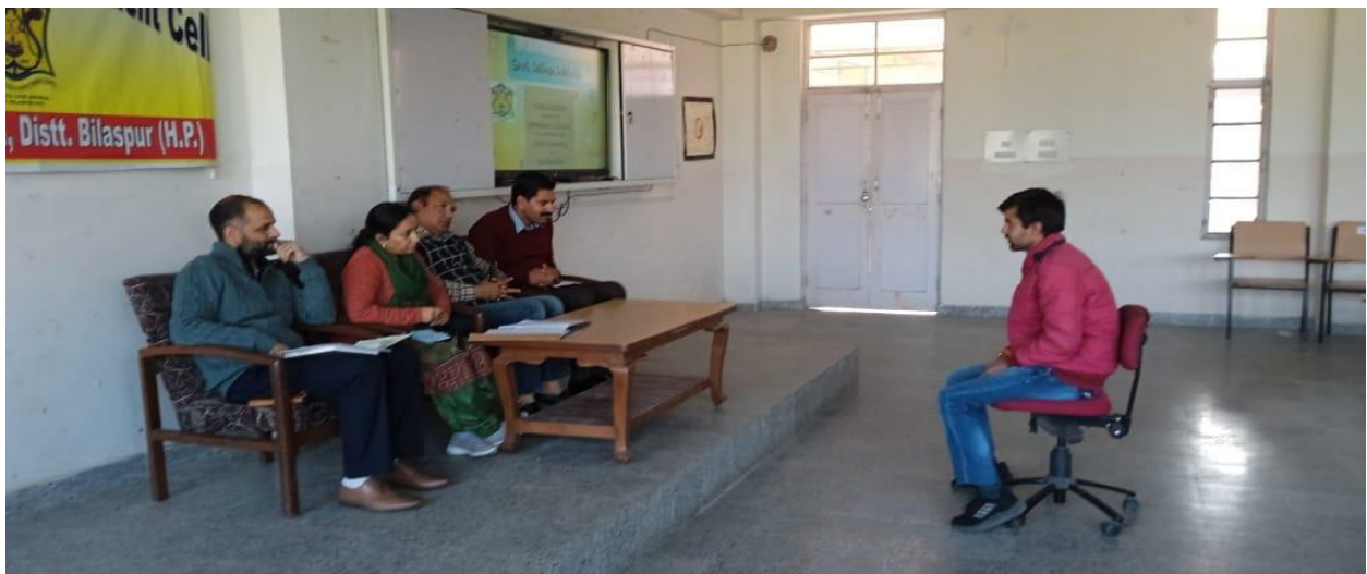
Students of B.Sc. & B.Com. 1 st year are attending the mock interviews.