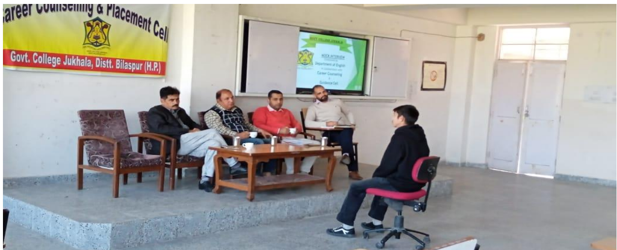
Mock-interviews are being done in the examination hall of Govt. College Jukhala.