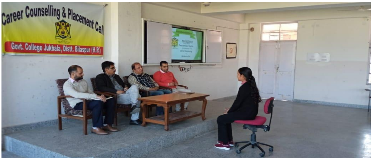
Girls are participating in the mock-interviews.