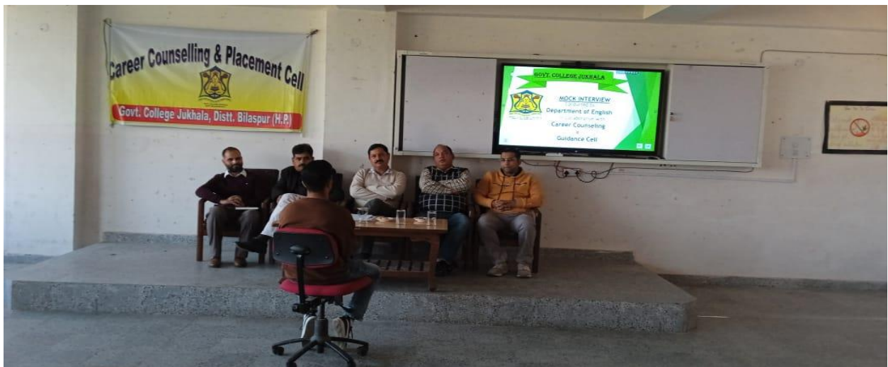
Students are attending the mock-interviews at Govt. College Jukhala.