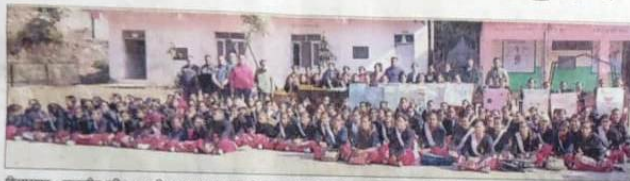
बिलासपुर : राजकीय शक्ति माध्यमिक छात्रा पाठशाला बिलासपुर में गणित दिवस के दौरान आयोजित विभिन्न स्पर्धाओं की प्रतिभागी छात्राएं स्टूडेंट्स के साथ सामूहिक चित्र में।