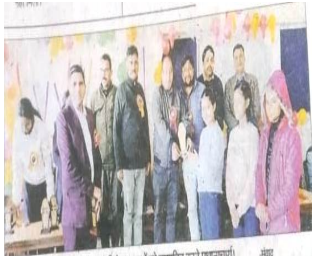
जुखला महाविद्यालय में विजेता छात्राओं को सम्मानित करते प्रधानाचार्या।